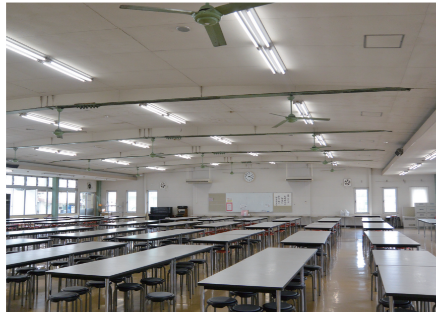
LED照明に取り替えられた食堂