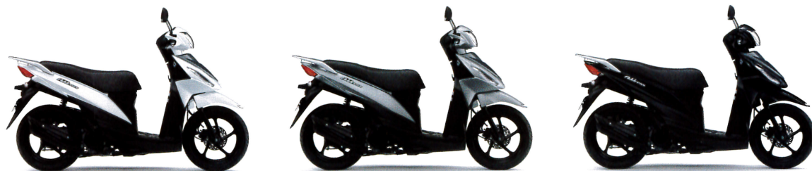
ブリリアントホワイト (YUH) アイスシルバーメタリック (YNJ) タイタンブラック (YVU)

毎日を快適に彩る、走りと燃費性能を 両立させた110ccスクーター アドレス110。