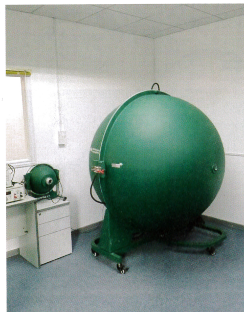
自社工場の積分球