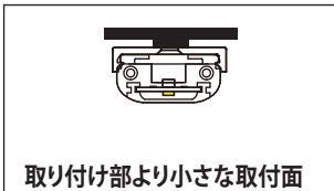
取付け部より小さな取付面