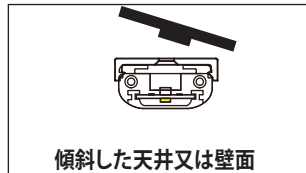
傾斜した天井又は壁面